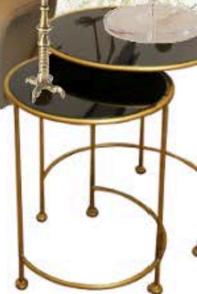
Mesas nido Detana