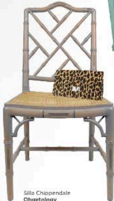
Silla Chippendale Obgetology