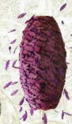
Lámpara Abyu Lighting