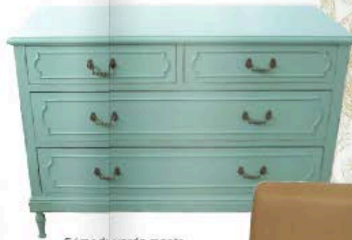
Cómoda verde menta Vintage and Chic